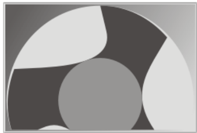
Nut im Schälnut-Schleifverfahren